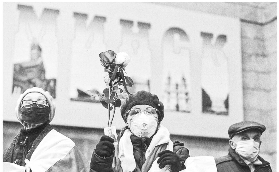
Hunderttausende protestieren in Weissrussland gegen die Wahlfälschungen durch das Lukaschenko-Regime.

Russland kam vergleichsweise gut durch die Coronakrise. Dank einem eigenen Impfstoff («Sputnik V») vermochte das Land auch aussenpolitisch zu punkten. Hingegen setzte der Zerfall der Erdölpreise dem Land wirtschaftlich zu. In Europa und den USA eckte das Putin-Regime mit