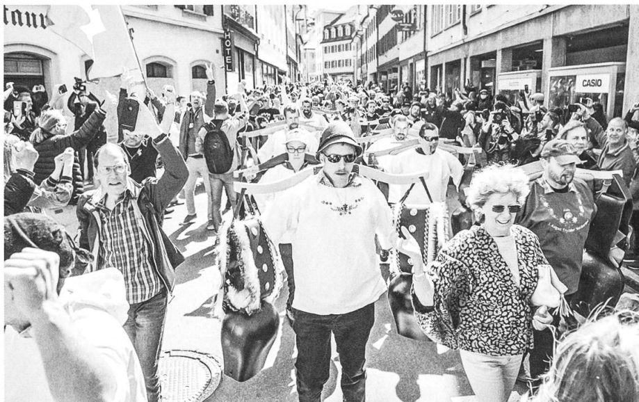
Coronaskeptiker in Altdorf an einem nicht bewilligten Demonstrationszug am 10. April 2021.

Gäste empfangen. Hingegen blieben die Restaurants geschlossen, nur Aussenterrassen durften öffnen. Die Situation entspannte sich erst, als der Bundesrat am 21. April einen Dreistufenplan für die Rückkehr zur Normalität bis zum 31. Juli bekanntgab. Entgegen den Prognosen der wissenschaftlichen Task Force sanken die Ansteckungszahlen in der ersten Maihälfte auf unter 1500 pro Tag. Deutlich weniger Menschen starben noch an Covid-19. Insgesamt wurde in der Schweiz in den ersten Monaten 2021 sogar eine «Untersterblichkeit» registriert.