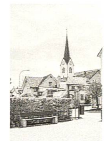
Rundgang durch Oberegg und Reute, S. 88