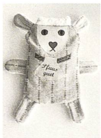
Stääsack selber machen, S. 83