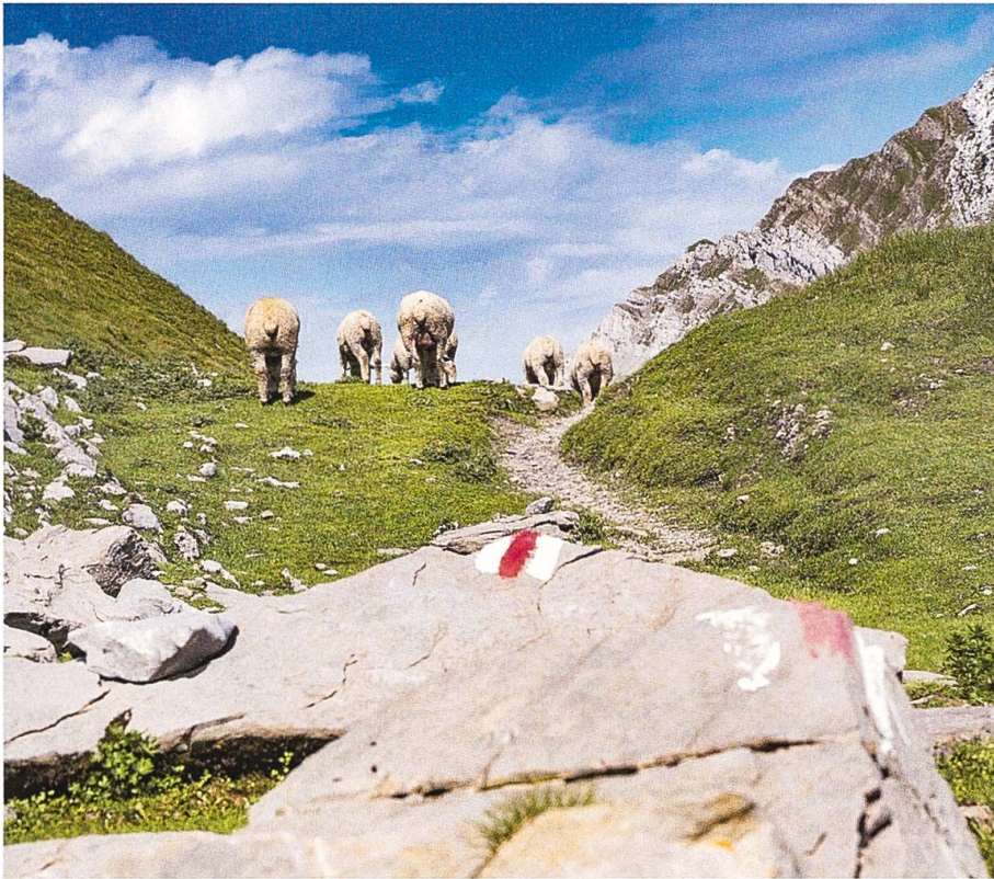
Im Berggebiet mit stark frequentierten Wanderwegen ist der Einsatz eines Herdenschutzhundes nur bedingt möglich.