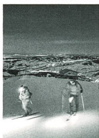
Mit Tourenski unterwegs auf die Ebenalp, S. 64