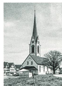
Dorfspaziergang durch Hundwil, S. 86