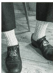
Sennensocken selber stricken, S. 81