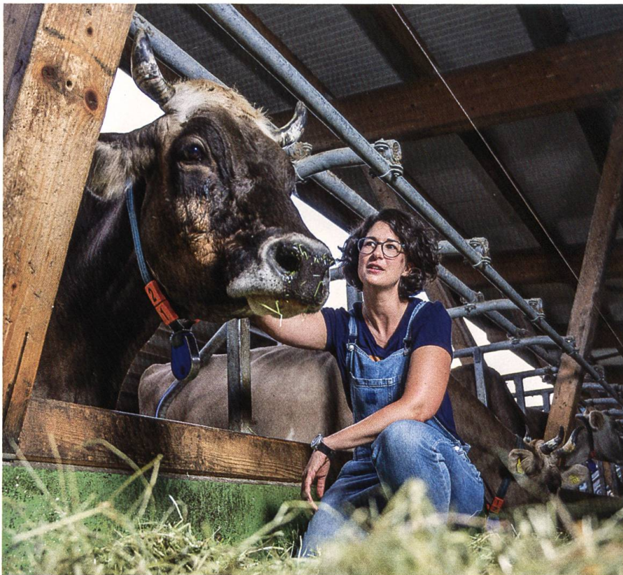
Trotz homöopathischer Behandlung kann die Milch der Kuh verwendet werden.

Homöopathen wird nachgesagt, dass sie der Schulmedizin gegenüber kritisch eingestellt sind. Wie sieht das bei Ihnen aus?