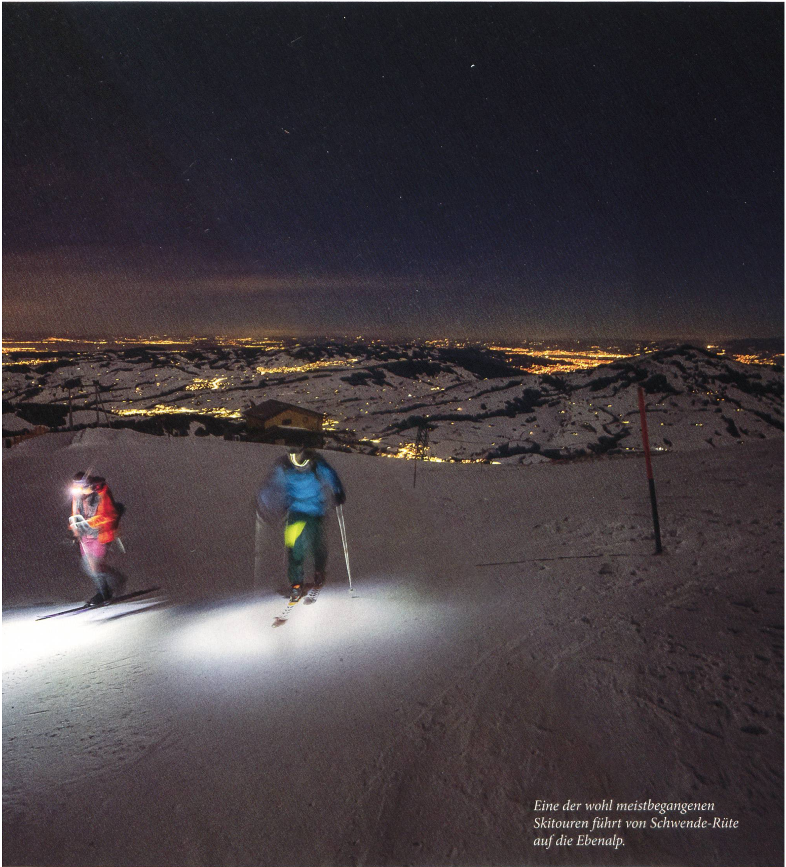
Eine der wohl meistbegangenen Skitouren führt von Schwende-Rüte auf die Ebenalp.