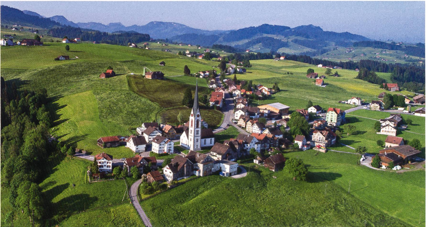
Die Gemeindefläche Hundwils erstreckt sich über eine Länge von vierzehn Kilometern.

Hundwil blickt auf eine lange Geschichte zurück, davon zeugen der Landsgemeindeplatz und die zahlreichen traditionellen Appenzeller Häuser an der Dorfstrasse. Erstmals wurde die Ortschaft im Jahr 921 als Huntwilare erwähnt. Zusammen mit Appenzell und Urnäsch war Hundwil von 1401 bis 1429 treibende Kraft in den Appenzeller Kriegen. Damals wurde das Ge-