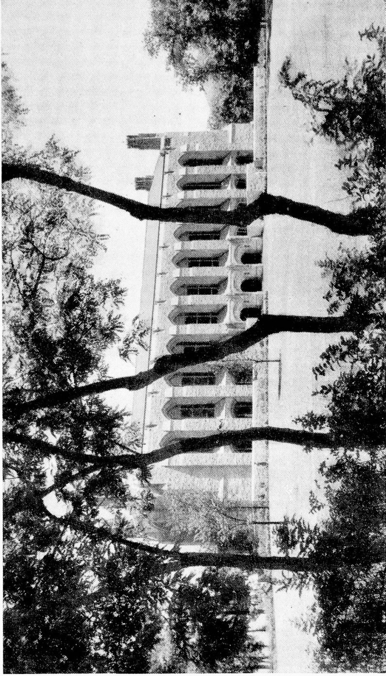
Bibliothèque de la Northwestern University à Evanston - Chicago