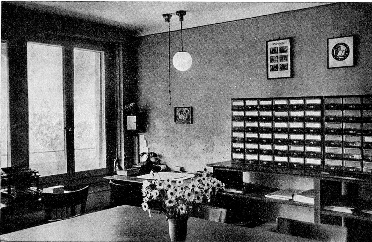
Der Zentralkatalog unserer 7 Kreisstellen in Bern

Bibliothekarbeit ist nie Selbstzweck, sondern sie bedeutet Dienen, und Bibliothekarbeit gedeiht nur bei hilfsbereiter Zusammenarbeit. Dienen und helfen: dies soll der Wahrspruch der Schweizerischen Volksbibliothek auch fürderhin sein.