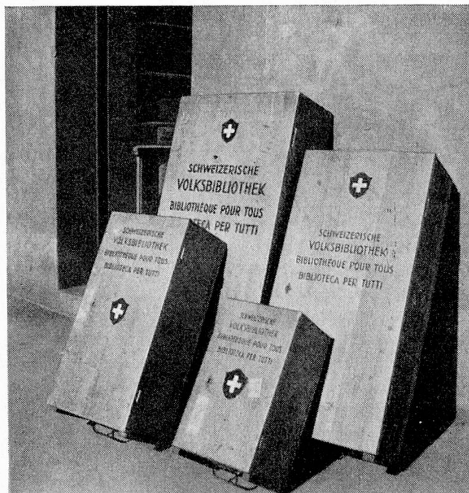
Kisten zu 100, 70, 40 und 20 Bänden