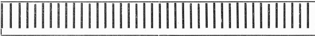
Möblierung mit Quergestellen: Platz für 53 700 Bände