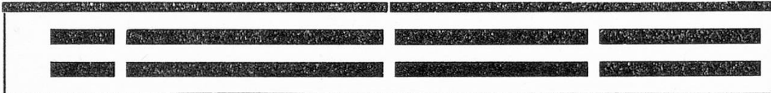
Möblierung mit Längsgestellen: Platz für 48 180 Bände

Der Aufbau und die Funktionsweise des Compactussystems wird am einfachsten an Hand einer Beschreibung dieser Anlage zu erklären sein, wobei allerdings zu beachten ist, daß sie durch die örtlichen baulichen Gegebenheiten von vorneherein an bestimmte Ausmaße gebunden war.