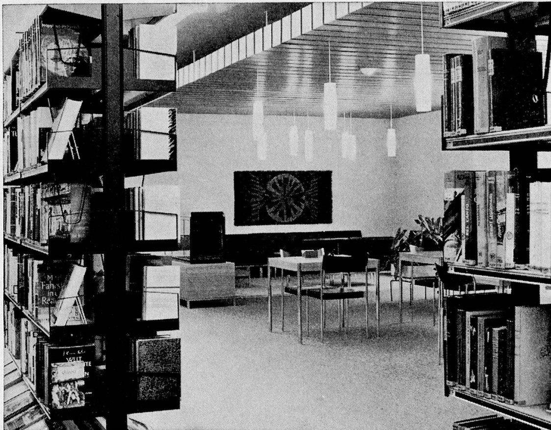
Berner Volksbücherei, Monbijoustraße

Freistehend oder an die Wand montierbar. Beliebige Ergänzung und Kombination der Gestelle, ohne Schrauben verstellbar.