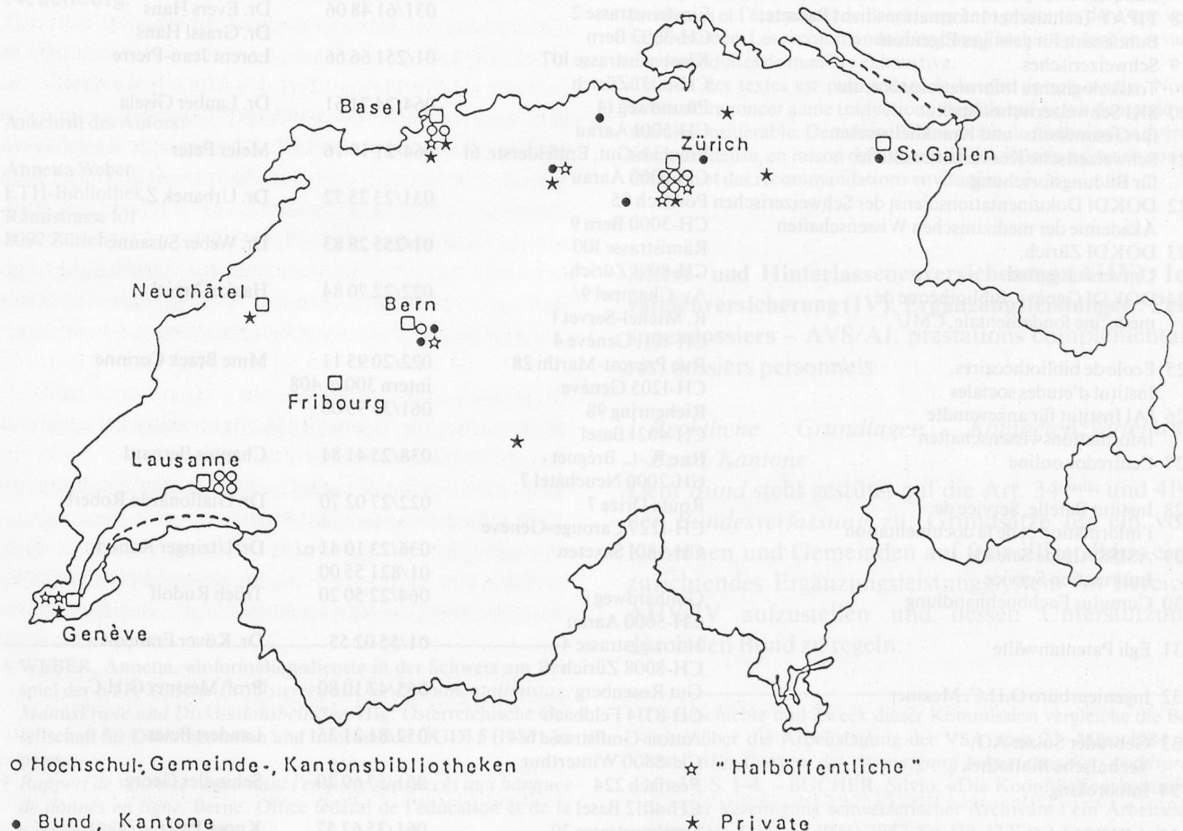
Standort der öffentlich zugänglichen Informationsdienste

Ausgehend von einer Liste von Institutionen bzw. Personen aus einer 1984 vom Bundesamt für Bildung und Wissenschaft durchgeführten Studie über die vorhandenen Online-Informationdienste 2 , konnten dank des «Schneeballeffektes» 35 Informationsstellen ausfindig gemacht werden. Dieses Vorgehen erlaubt gewiss keine lückenlose Zusammenstellung, und die Ergebnisse erheben somit keinen Anspruch auf Vollständigkeit. Bei fehlerhaften oder unvollständigen Angaben sowie bei nicht berücksichtigten Informationsdiensten bin ich für eine Mitteilung dankbar; dies könnte die periodische Veröffentlichung einer solchen Liste auf dem jeweils neusten Stand ermöglichen.