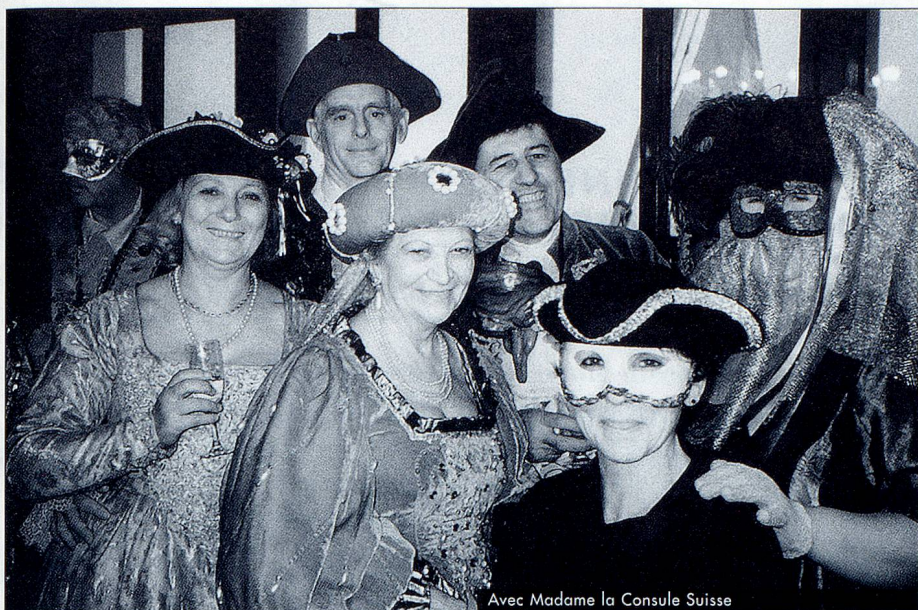
Avec Madame la Consule Suisse

restreinte aux salles du rez-de-chaussée, les autres étages étant en rénovation (comme beaucoup d'autres bâtisses dans cette ville fragilisée par son environnement). En fait, la direction avait omis de nous le signaler lors de notre réservation; ce fut donc une visite écourtée mais néanmoins impressionnante: à l'entrée les esquisses de Tiepolo évoquant le Carnaval au 18 e siècle nous ont enchantées; de très belles peintures de Guardi et d'autres célèbres peintres vénitiens nous ont donné une idée de la richesse de cette collection exceptionnelle.