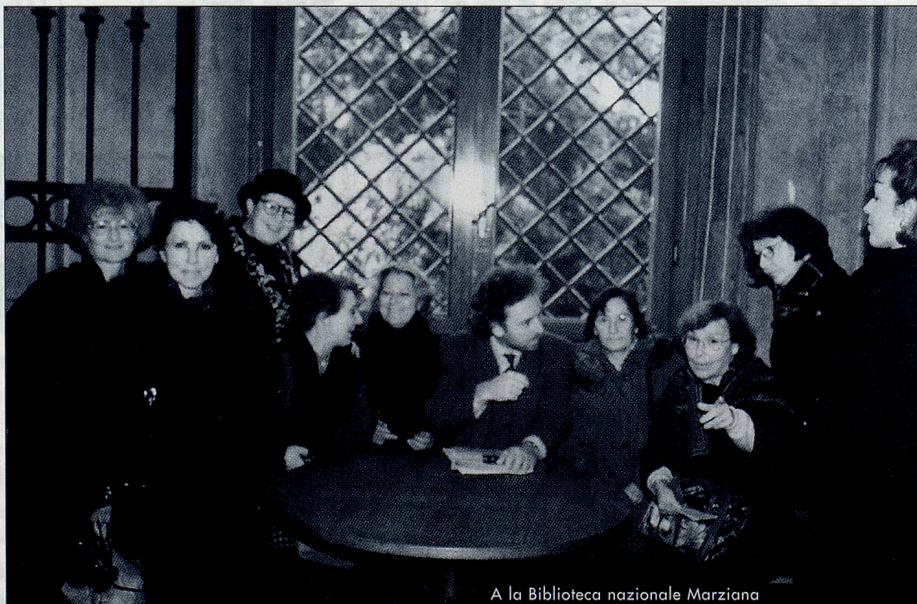
A la Biblioteca nazionale Marziana

La visite d'une autre demeure patricienne, la Casa Rezzonico, a dû être