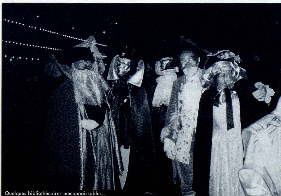
Quelques bibliothécaires méconnaissables...