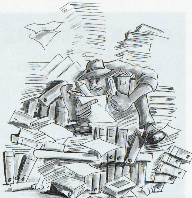
Das Wissen der Welt...

Anschliessend an diese eher düster anmutenden Thesen versucht Marc Schaffroth (Schweizerisches Bundesarchiv, Bern), das «Prinzip Hoffnung» zu praktizieren, und er stellt