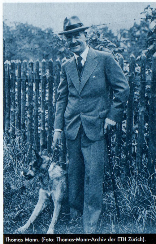
Thomas Mann.

Diese Sammlung literarischer Originalmaterialien gemeinsam unter einem Dach mit einer wissenschaftlichen Forschungsbibliothek zum Thema München ist eine geniale Kombination. Denn zum einen ist in der Monacensia eine lückenlose Rekonstruktion der Entstehungsgeschichte von Romanen, Erzählungen, Gedichten und Theaterstücken möglich: von der Idee über die Korrespondenz mit dem Verlag, zu Entwürfen und Textfassungen bis zur gedruckten Buchausgabe. Zum anderen findet der Literaturhistoriker und Publizist in der wissenschaftlichen Spezialbibliothek Sekun-