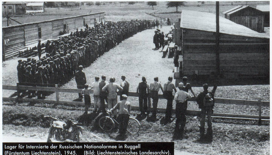
Lager für Internierte der Russischen Nationalarmee in Ruggell (Fürstentum Liechtenstein), 1945.

Das nun vorliegende, dreisprachige Inventar zeigt eine eindruckliche Vielfalt