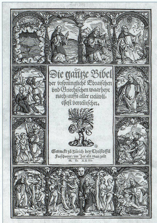
Bibel (deutsch), Zürich 1531. Die erste, aus dem Grundtext übersetzte, deutsche Vollbibel.

beit befindliche schweizerische Handbuch beziehen alle Bibliothekstypen ein – von der National-, Kantons-, Stadt- und Universitätsbibliothek bis hin zur Schul-, Kirchen- und Klosterbibliothek sowie bedeutenden Privatbibliotheken. Ziel