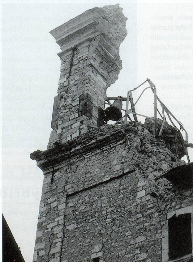
Schaden an einem Kirchturm nach einem Erdbeben in Umbrien, 1997.

Einen ersten Kontakt in Erdbebenfragen hat die Arbeitsgruppe bereits zur Universität in Siena geknüpft. Diese hat sich bereit erklärt, im Rahmen eines Masterkurses eine Arbeit mit dem Thema «Faktoren und Risikoanalyse sowie zu treffende vorsorgliche Schutzmassnahmen für mobile Kulturgüter in Archiven und Bibliotheken im Falle eines Erdbebens» zu übernehmen. So wird es möglich, dass viele wertvolle Erkenntnisse aus der Praxis, welche anlässlich der verheerenden Erd-