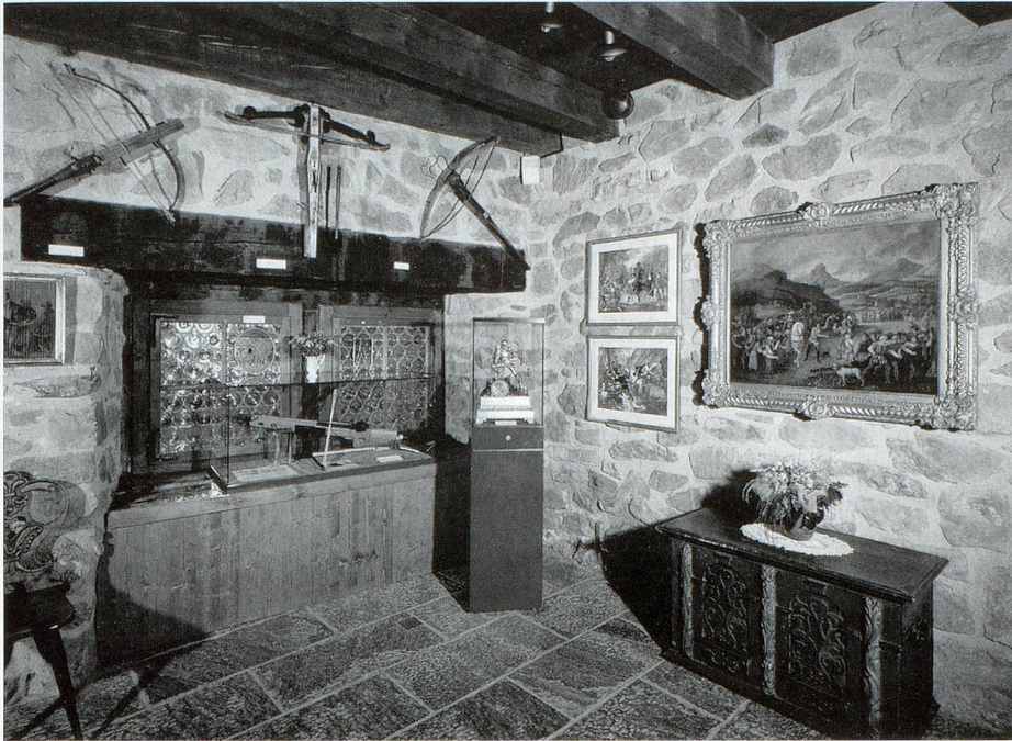
Innenansicht des sogenannten Wattigwilerturms: 166 m 2 Ausstellungsfläche sind dem Nationalhelden Tell und seiner Legende gewidmet.