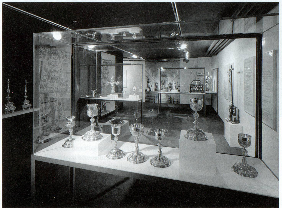
Der Altdorfer Kirchenschatz ist seit 1982 in einem unterirdischen Kulturgüterschutzraum untergebracht.

Der Kirchenschatz von Altdorf ist der reichste und künstlerisch bedeutendste in Uri. Der heutige Bestand erstreckt sich über die Zeit um 1300 bis ins 20. Jahrhundert. Darin enthalten sind Stücke von internationalem Rang.