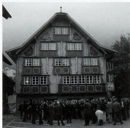
Apéro vor dem Talmuseum Ursern.