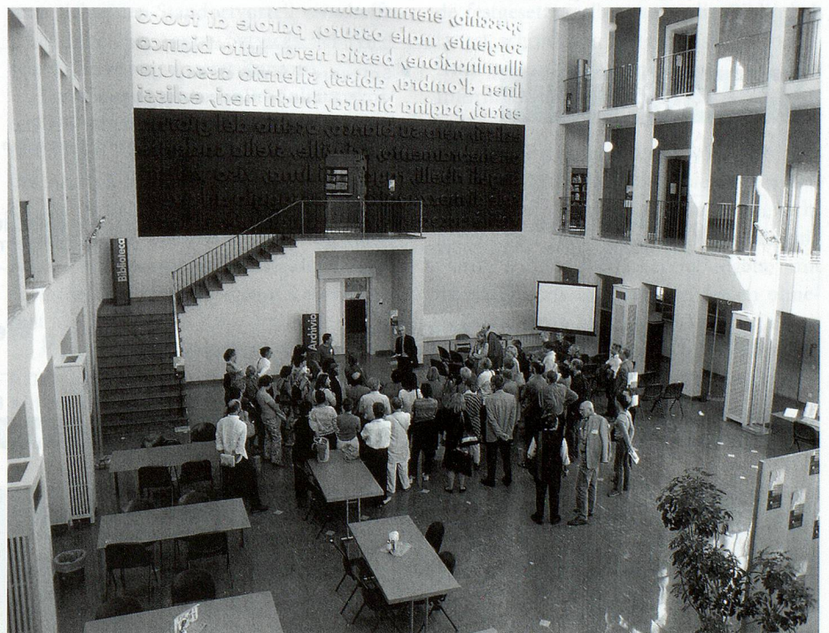
... und die fürstliche italienische Grandezza.

Bellinzona, das die Qualität – zumindest populäretymologisch – im Namen trägt, hat diesem Namen alle Ehre gemacht: Es war eine Zone der reinen Bellezza. Da war der Nordföhn, der durch die Täler wirbelte und dabei für einen gründlichen Hausputz sorgte, sodass das ganze Tessin in einmalig warmes und klares Spätsommerlicht getaucht war. Da war Bellinzona selber, für mich vorher das «Olten des Tessins»: durchfahren, umsteigen, aber nie wirklich aussteigen. Dabei ist es ein bezauberndes Städtchen von typisch oberitalienischem Ambiente, mit ansprechender Bausubstanz, netten Plätzchen zum Sitzen und Bechern und einer charmanten Flanierallee hin zum Bahnhof. Vom grossarti-