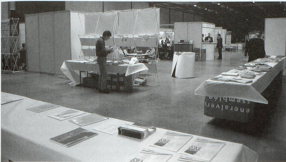
Der diskrete Charme der Lagerhalle ...

waren, bedauerten, dass sie vom Kongressvolk so wenig zur Kenntnis genommen wurden.