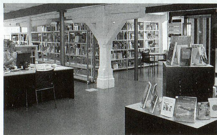
Der Bereich «Computer und Technik» mit dem zentralen Info-Desk.