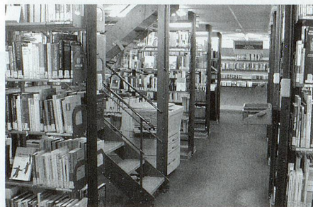
Freihandbibliothek von 1993 im ehemaligen Magazinrakt.

Die Stagnation der Bibliotheksnutzung seit den 1950er Jahren verlangte eine konsequente Neuorientierung.