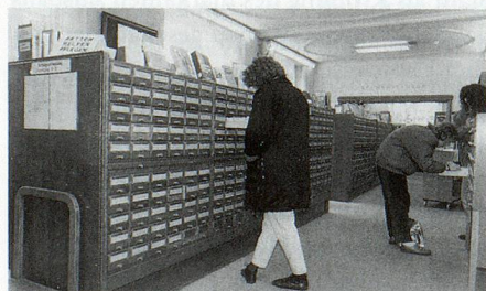
Der Sachkatalog der Stadtbibliothek Winterthur 1990.

dass eine frei zugängliche Präsentation der Bestände immer weniger möglich war.