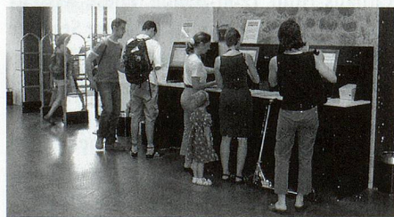
Selbstverbucher und Sicherungsgates im Eingangsbereich der Stadtbibliothek.

Der allzu wissenschaftliche Bestand war zugunsten der allgemein bildenden Sachbücher, der Fachliteratur für die Gymnasialstufe und den Unterbau der verschiedenen Studienrichtungen sowie des zeitgenössischen Literatur- und Kulturschaffens auszuweiten. Ein aktives Informations- und Bildungszentrum sollte sich auch nicht nur auf die Printmedien beschränken.