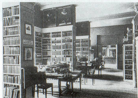
Die Stadtbibliothek in der Knabenschule von 1842 bis 1916.

Die Publikationsflut in der zweiten Hälfte des 19. Jahrhunderts führte dazu,