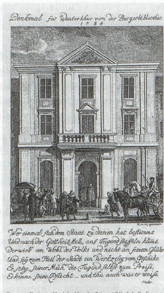
Das neue Rathaus von 1784. Neujahrsblatt der Bürgerbibliothek Winterthur von 1784.

che kamen das zeitgenössische Literatur-schaffen und allgemein verständliche Sachbücher hinzu. Alle Werke waren in frei zugänglichen Gestellen nach Sachbereichen geordnet aufgestellt. Für die Arbeit im Hause standen neben den grossen Fenstern Arbeitstische.