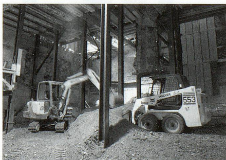
Raum für Konzepte.

Das Bibliotheksprodukt im Speziellen ist nicht einfach nur Medienausleihe, sondern wesentlich komplexer. Innere Stim-