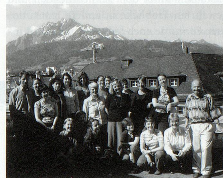
Die Ausgezeichneten und ihr Kursleiter.

Generell kann festgestellt werden, dass der Gesamteindruck bei den Studierenden und Dozierenden sehr gut war. Auffallend bei der Gesamtbewertung ist, dass die