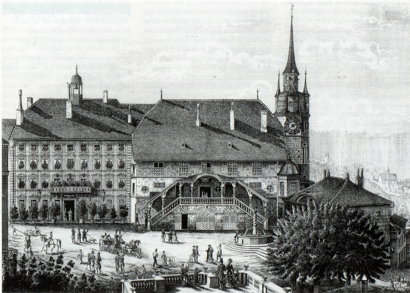
Jouxant l'Hôtel de Ville, la Maison de Ville, siège de l'Administration communale et de ses Archives. D'après une lithographie de J. Lang, fin du XIX e s.

N° inv. 10626.