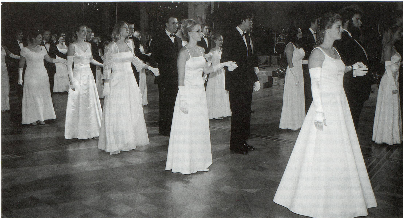
Wiener Ball – «Der Kongress tanzt».