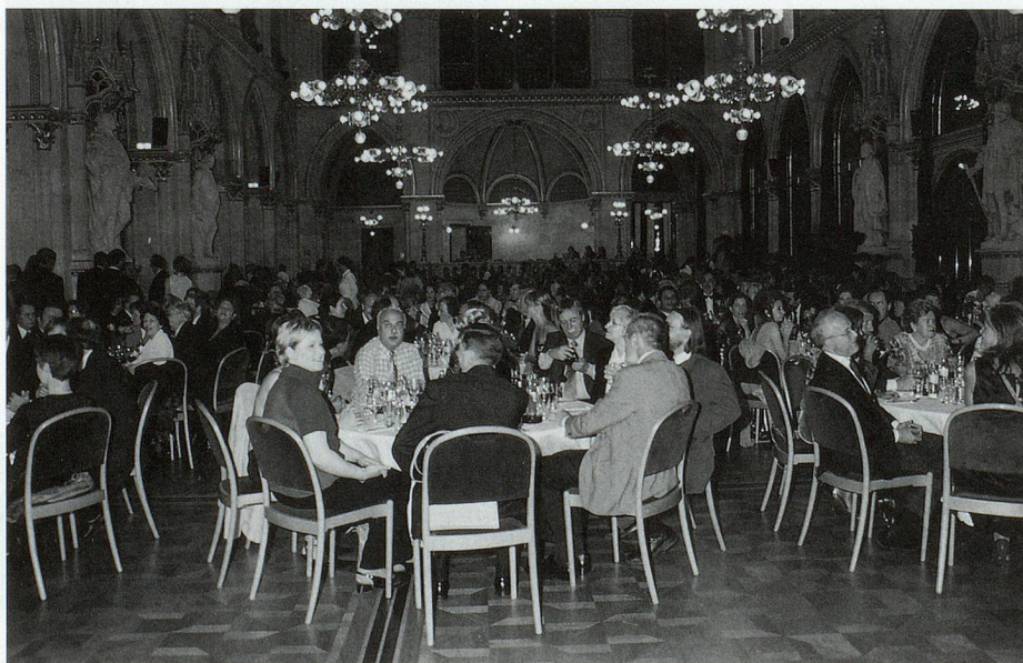
Im Festsaal des Wiener Rathauses.