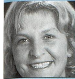
■ Bärbel Förster VSA-Redaktorin Arbido Schweizerisches Bundesarchiv