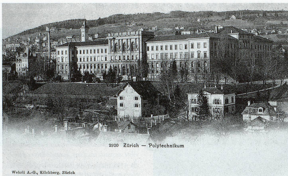
Zum 150-Jahr-Jubiläum der ETH Zürich werden die Schulratsprotokolle online publiziert.

Die neu aufgeschaltete Lösung ( www.sr.ethbib.ethz.ch ) eröffnet dem Nutzer zahlreiche und umfassende Recherchemöglichkeiten, wie etwa das Browsen über einen