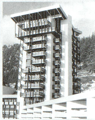
Tour d'Aminona (VS), André et Francis Gaillard, architectes, vers 1970–1971.

La carrière d'André Gaillard se déroule pour l'essentiel à Genève. Il participe activement à la réalisation de nouveaux quartiers de logements, notamment l'ensemble résidentiel de Morillon-Parc, mais aussi à l'édification des villes nouvelles d'Onex et de Meyrin. Il construit également des bâtiments publics comme le temple de Châte-