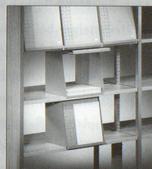
Präsentation und Aufbewahrung von Zeitschriften