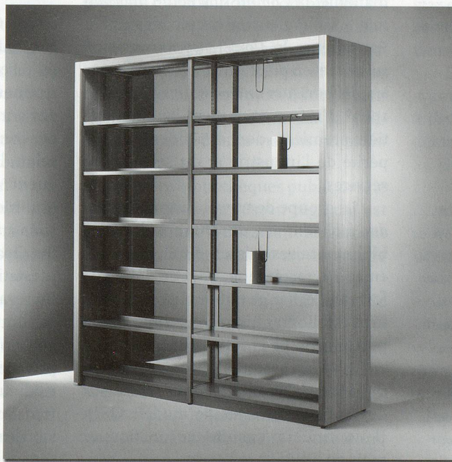
Funktionalität und Ästhetik