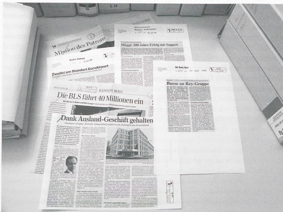
Traditionelle Zeitungsausschnittsammlung des SWA. Ab 2013 werden die neu archivierten Ausschnitte elektronisch abgespeichert und angeboten.

Seit dem 19. Jahrhundert ist die Zeitung das Leitmedium. Den Zeitungsausschnitten eigen ist ihre diskursive Aussagekraft. Sie kommt besonders gut zum Tragen, wenn die Ausschnitte in thematischen Dossiers zur Verfügung gestellt werden. Debatten zu einzelnen Themen können damit mühelos über längere Zeiträume nachvollzogen werden. In den letzten Jahren wurden aufgrund des technischen Wandels in der Medienwelt (Internet, Newsportale, Onlinezeitungen) und aufgrund knapper Ressourcen viele Sammlungen eingestellt. Eine Ausnahme bildet hier das SWA, welches seine Zeitungsausschnittsammlung zu wirtschaftlichen Sachfragen, Firmen und Verbänden sowie Personen der Wirtschaft seit Anfang 2013 elektronisch führt und die elektronisch abgelegten Ausschnitte online zur Verfügung stellen wird. Damit soll den Benutzerinnen und Benutzern weiterhin ein Informationsprodukt hoher Qualität zugänglich sein. Denn die Ausschnitte werden wie bis anhin intellektuell selektiert und einem (elektronischen) Dossier zugeordnet. Sie bleiben damit dem bestehenden Dossierzusammenhang erhalten (Vermeidung eines Medienbruchs). Die Abspeicherung der einzelnen Artikel im PDF-Format erlaubt zudem den Erhalt der ursprünglichen Form (Authentizität).