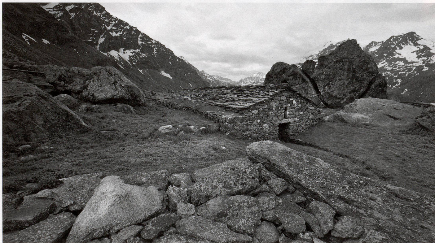
Stall, Le Crêt, Val de Bagnes