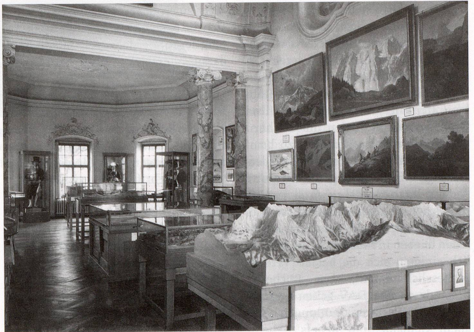
Dieser Blick in einen Ausstellungssaal des Alpen Museums zeigt die im Zweiten Weltkrieg zerstörte Ausgestaltung des ehemaligen Lustschlosses «Isarlust», 1930er-Jahre.

Sammlungsverzeichnisse sind nicht erschienen, ein Museumsführer von Carl Müller aus dem Jahr 1916 wurde erst 1930 durch einen als Sondernummer der Deutschen Alpenzeitung veröffentlichten Museumsrundgang von Walter