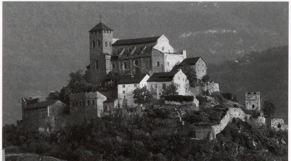
Le Musée d'histoire du Valais occupe les anciennes maisons capitulaires du château de Valère, à Sion

Au niveau cantonal, l'Association valaisanne des musées, fondée en 1981, a été un instrument important de rencontre entre «conservateurs» de milice, les musées cantonaux servant dans ce cas de modèles de référence. L'association a aussi tenté d'éviter la multiplication d'institutions semblables, en militant pour une complémentarité qui n'a pas toujours été comprise dans un canton où, entre 1975 et la fin du XX e siècle, le nombre de musées est passé de 25 à plus