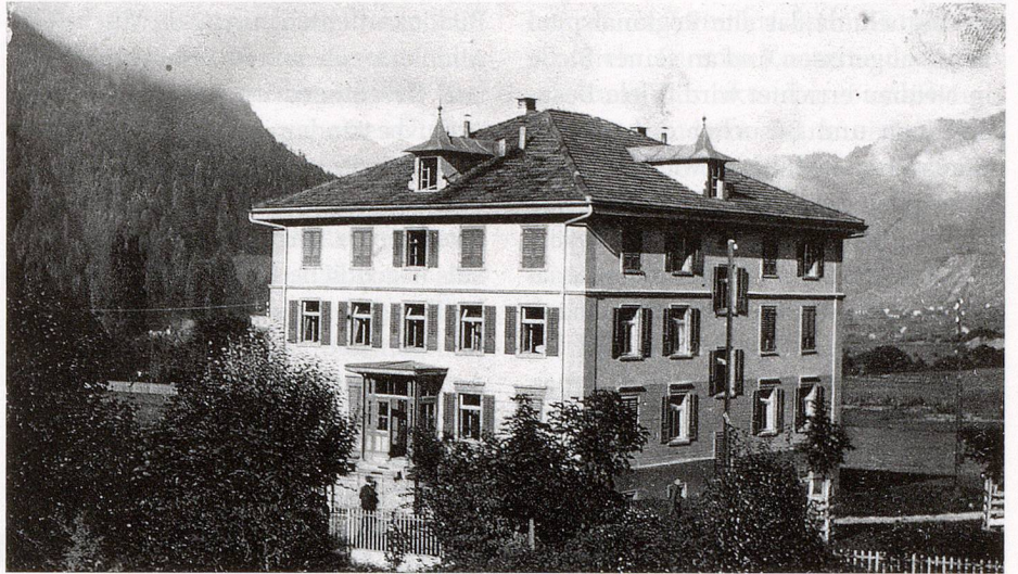
Ansichtskarte «Spital Schiers», gelaufen 1909.