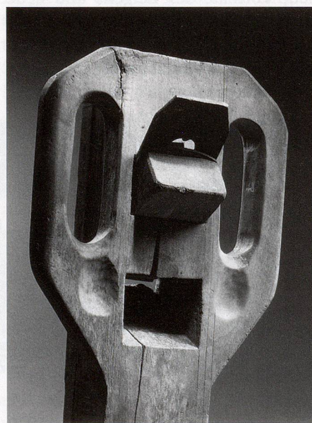
Rabot galère (coll. Musée de Bagnes, photo: Hughes Dubois)

Dépendance de l'Abbaye de St-Maurice depuis le XII e siècle au moins, le val de Bagnes ne peut se raconter qu'en recourant aux archives de cette institution auxquelles la commune a apporté son soutien. Il existe cependant un ensemble toujours conservé par l'administration communale. Les plus anciennes pièces remontent au XIV e siècle. Un inventaire des documents antérieurs au XX e siècle a été réalisé par les Archives cantonales du Valais. Les documents produits depuis le XX e siècle par l'administration communale ont été déposés sans modifier le classement établi par les différents services, au gré de l'évolution du personnel administratif et de la constitution des dicastères politiques. En 2012, devant l'ampleur de la tâche, le conseil communal a créé un poste d'archiviste et conservateur du patrimoine confié à Julie Lapointe Guigoz. Après plusieurs mois consacrés à l'inventaire sommaire des fonds répartis dans différents locaux, elle a commencé le classement de ces archives contemporaines tout en assurant le suivi avec les services communaux. En 2013, un important travail de conservation a été confié à Roberta Cozzi (Atelier RC) portant en particulier sur les «registres anciens». Ce programme de restauration est planifié sur