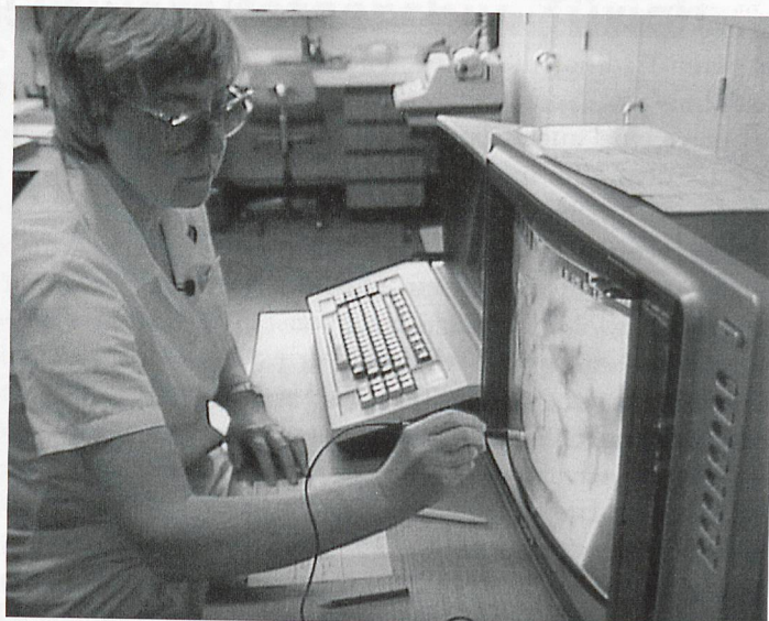
Neben Beispielen historischer Visualisierungstechniken dokumentieren die vom UAZ überlieferten medizinischen Gebrauchsfilm auch eine jeweils zeitbedingte Selbstdarstellung. [Standbilder aus: Television Universität/Departement für Frauenheilkunde, Was nun? – Selbstuntersuchung der Brust (1983), UAZ E.17.1.004.]

den, da diese durch die Zentralbibliothek Zürich aufbewahrt werden.