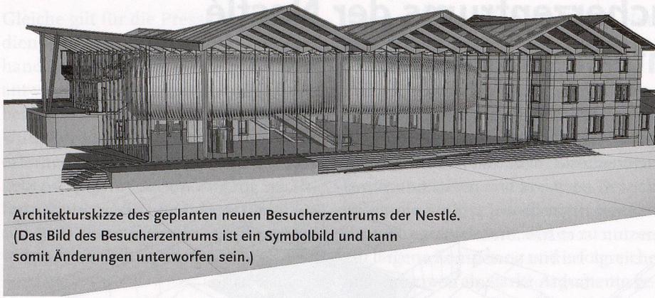
Architekturskizze des geplanten neuen Besucherzentrums der Nestlé. (Das Bild des Besucherzentrums ist ein Symbolbild und kann somit Änderungen unterworfen sein.)

– Wie viel Storytelling, also Geschichtenerzählen, und wie viel Geschichte fließen in die Ausstellungen zur Vergangenheit ein?