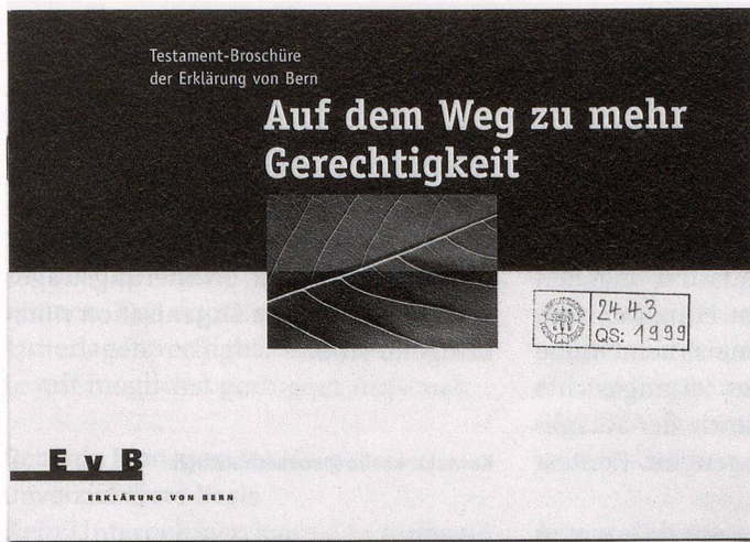
Testament-Broschüre der Erklärung von Bern (EvB), 1999.