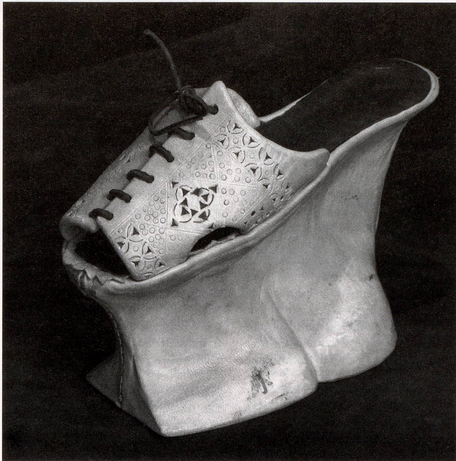
Image «Shoemuseum Lausanne-IMG 7291» by Rama & the Shoe Museum in Lausanne – Own work. Licensed under CC BY-SA 2.0 fr via Wikimedia Commons.

Tous deux ont la charge d'un module du Bachelor en Information documentaire consacré à la communication 2.0 dans lequel une partie des cours est consacrée à l'édition Wikipédia.