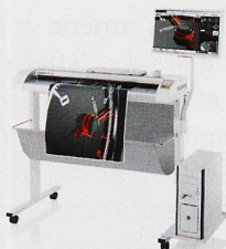
Planscanner Scanbreiten von 61 bis 152cm