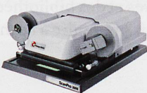
Mikrofilmscanner für alle Mikrofilmarten