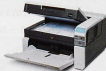
Dokumentenscanner Geschwindigkeit bis 210 Seiten/Min.