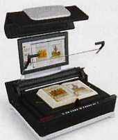
Buchscanner Vorlagengrößen von A3 bis A0