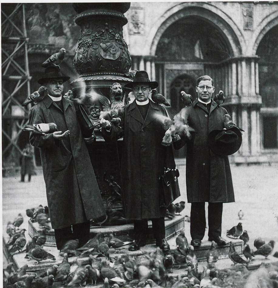
Bei der Ausreise nach Südrhodesien im Jahr 1939 machen drei Immenseer Missionare Zwischenhalt in Venedig, bevor die Reise mit dem Schiff weitergeht.

Die im Archiv aufbewahrten Unterlagen legen Zeugnis ab vom vielfältigen weltweiten Wirken der Immenseer Missionare, deren missionarische Tätigkeit sehr weit gefasst werden muss. So sind denn die Archivalien auch nicht nur für kirchlich Interessierte von Bedeutung. Anhand der Akten, Fotos und Filme lassen sich bedeutende Leistungen der Immenseer Missionare erforschen, sei dies nun moderne Kirchenarchitektur in Japan und Taiwan, medizinische Ethik, indigene Sprachen und Übersetzungen, japanisches Theater, taiwanische Musik, afrikanische Instrumente und anderes mehr. Die Immenseer Missionare gründeten eine afrikanische Schnitzerschule, bauten Staudämme, errichteten Lehrlingswerkstätten und führten eine Druckerei. Sie erlebten den Befreiungskrieg in Simbabwe hautnah, verloren Mitbrüder und blieben auch in höchster