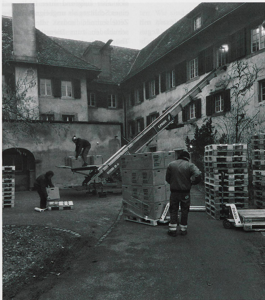
Abb. 2: Transport der Bücher in Umzugskisten.

Die Benutzung war in dieser Zeit gering. Die Bestände waren wenig sichtbar: Zwar war der zentrale Zettelkatalog der Schweizer Kapuziner, in dem sich auch Solothurner Bestände finden (mit Sigle «SO», ohne Signaturen), bereits seit einiger Zeit in digitalisierter Form abrufbar, aber nur als Imagekatalog und daher weder in einen der einschlägigen Verbünde noch in Metasuchmaschinen integriert. Dennoch erhielten wir gelegentlich Anfragen, z.B. nach einer Broschüre, die damals in den grossen Bibliothekskata-