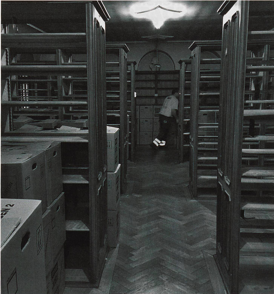
Abb. 1: Gestelle.

nach derjenigen des Mutterklosters Wesemlin in Luzern. Dies ist auf den Umstand zurückzuführen, dass das Kapuzinerkloster Solothurn über Jahrhunderte als Studienkloster diente. Das Kloster befand sich seit 1592 am selben Standort, und seine Bibliothek konnte in einem Zeitraum von über 400 Jahren ununterbrochen aufgebaut und gepflegt werden. Das Kloster überstand sowohl die Zeit der Helvetik als auch den Kulturkampf im Kanton Solothurn ohne Plünderungen oder Aufhebun-