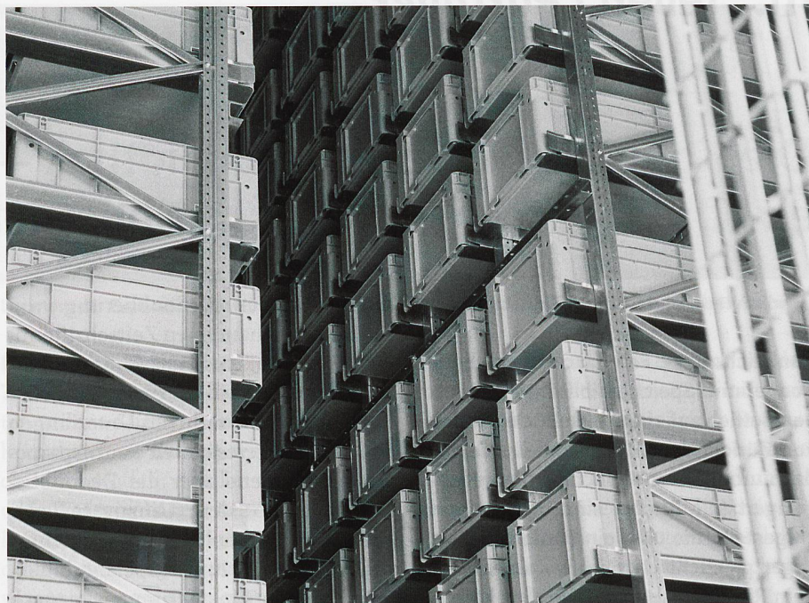
Bilder: Heute, gut zwei Monate nach Beginn der Ersteinlagerungen, sind rund 270 000 Bände eingelagert. In diesem Tempo geht es nun weiter, beinahe eineinhalb Jahre, bis die angemeldeten 2,5 Mio. Bände eingelagert sind. Bibliotheken bleiben ein Massengeschäft, auch mit modernster Technologie!

thek, und das Personal ist nicht über eine der teilnehmenden Einrichtungen der öffentlichen Hand angestellt, sondern von der Speicherbibliothek.