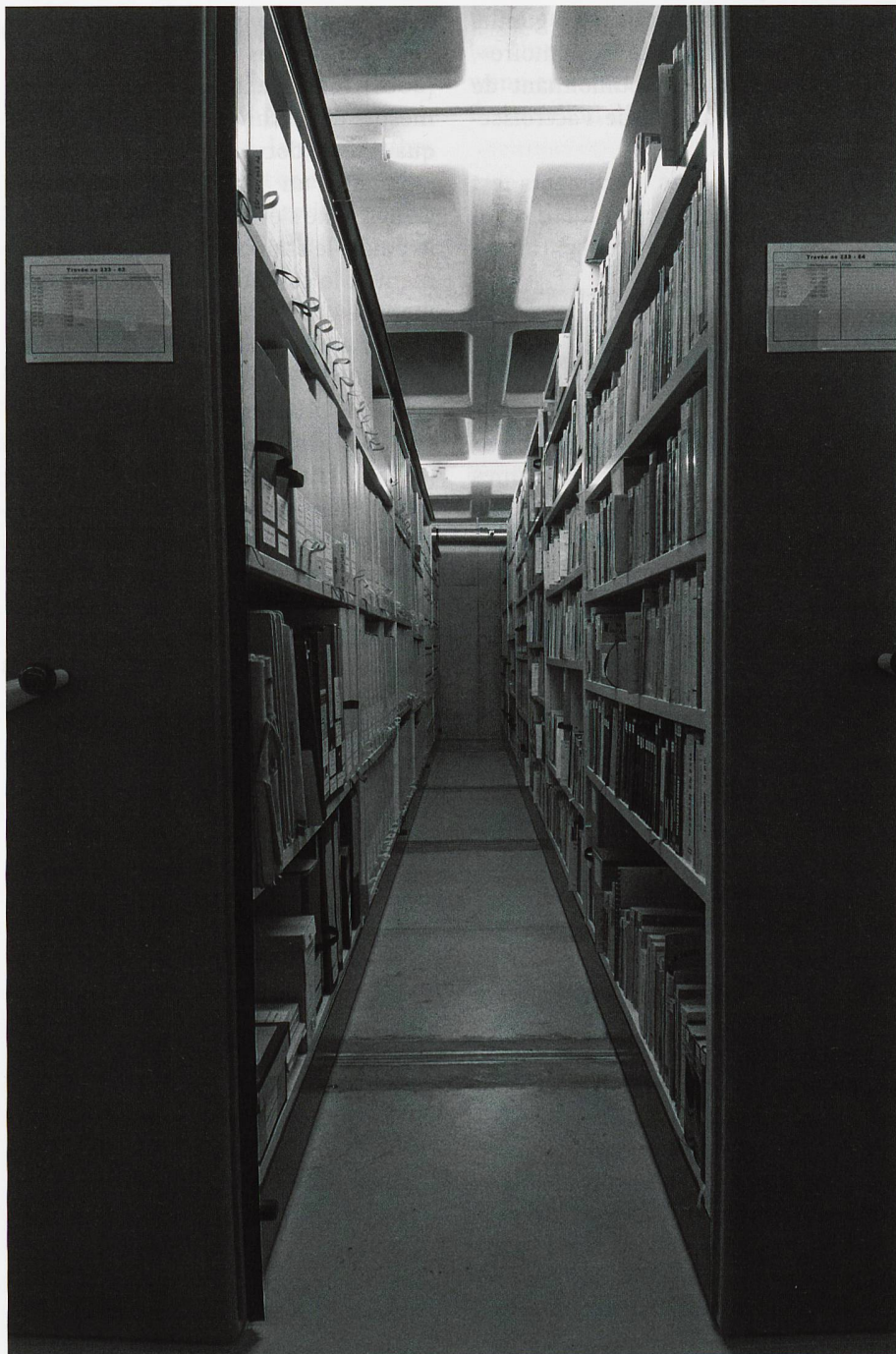
Des fonds d'archives traités, c'est-à-dire reconditionnés et décrits dans un inventaire, afin de pouvoir retrouver l'information recherchée.

L'archiviste est davantage qu'un spécialiste des rebuts, il doit être reconnu pour ses compétences d'évaluation.