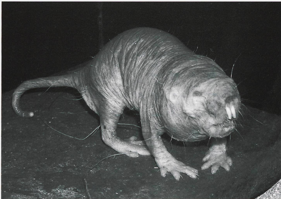
Ill. 2: Le rat-taupe nu ( Heterocephalus glaber ) est un petit rongeur remarquable non seulement pour son apparence physique.

gardé en tant qu'espèce. Par contre, des recherches de 2005 ont montré que l'animal pouvait vivre jusqu'à 50 ans, qu'il était insensible à la douleur et surtout qu'il avait une forte résistance aux maladies cancéreuses. Cela l'a remis de facto sur le podium des animaux suscitant l'intérêt des humains. Par analogie, effacer une donnée aujourd'hui ne veut pas dire qu'elle n'aura pas d'importance à l'aulne des critères du futur. Et si les coûts sont inférieurs ou équivalents, pourquoi éliminer l'information?