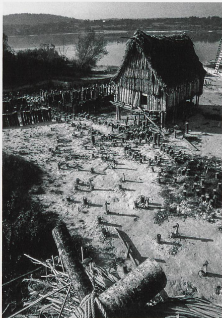
Ill. 3: Reconstitution d'une maison néolithique à Chalain. L'archéologie expérimentale s'appuie sur les données de fouilles pour proposer une lecture plausible de la vie quotidienne au Néolithique. Tous les vestiges retrouvés lors de la fouille sont alors mis à contribution pour approcher une réalité passée.

Que faire des objets? Que faut-il garder, que faut-il jeter? Pourquoi des musées? Comment faire un nouveau musée? Que faut-il y montrer? Comment imaginer ses nouvelles fonctions? Y a-t-il d'autres solutions que la solution muséale? Ce sont les questions que l'on peut se poser avec l'apparition en ce début de siècle de grosses machineries muséales dans les principales villes d'Europe.