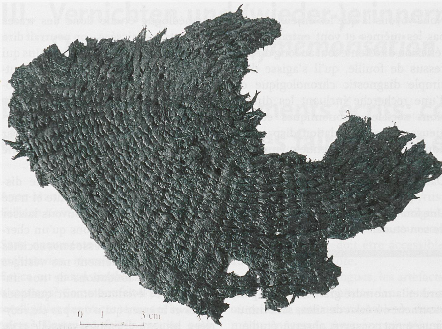
Ill. 2: Fragment de sparterie de Clairvaux XIV. 38 e siècle av. J.-C. La découverte de fragments de textiles et de sparteries est toujours un moment d'émotion pour l'archéologue qui se trouve subitement face à face avec l'artisan de tels objets, mais cet artisan a disparu depuis près de 60 siècles.