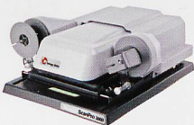
Mikrofilmscanner für alle Mikrofilmarten (Rollfilme, Mikrofichen, etc)