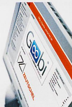
Goobi ZED Software-Lösungen für Digitalisierungsprojekte