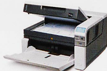
Dokumentenscanner Geschwindigkeit bis 210 Seiten/Min.