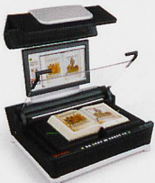
Buchscanner Vorlagengrößen von A3 bis A0