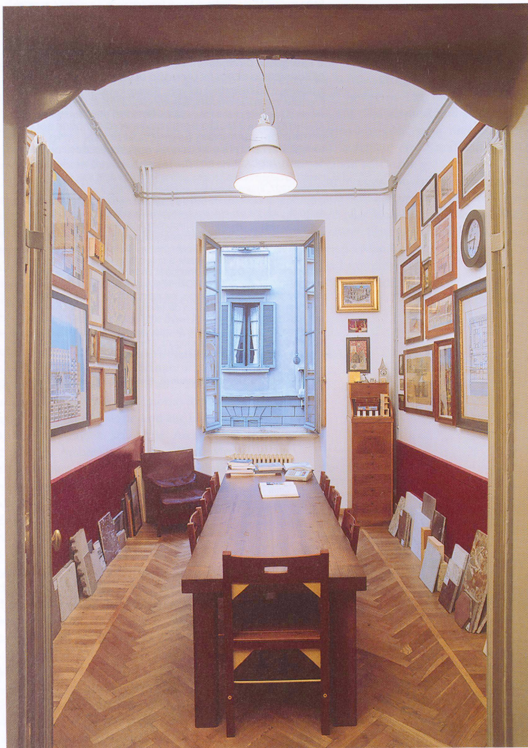
Lo studio di Aldo Rossi in Via Santa Maria alla Porta 9 a Milano.