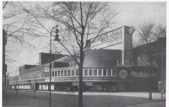
Cinema Universum, Berlino 1926/28

sterno, e a differenza dell'analisi contenuta ne L'opera d'arte nell'epoca della sua riproducibilità tecnica , in cui Benjamin parlava di tecnologia nascosta per creare un'illusione artificiale della realtà molto efficace, qui «l'apparecchiatura», è discretamente esibita ottenendo così «un'immagine» fortemente caratterizzata. L'Universum si può considerare un'evoluzione dell'impianto del teatro, così come l'arte cinematografica ha superato con i propri mezzi i limiti dell'arte teatrale, il cinema trova, nell'unicità del suo spazio, una precisa autonomia che si riflette anche nelle forme esterne dell'edificio; dentro la città diventa manifesto di se stesso. 7 Se esiste una tradizione del cinema quale edificio pubblico, a distanza di anni ci interroghiamo sulla capacità del progettista di coglierne gli aspetti essenziali compatibilmente con le nuove esigenze di produzione del cinema e di riuso della città. L'idea di uno spazio extra-architettonico emerso fin qui assume una posizione dialettica rispetto al mondo delle immagini mutevoli dello schermo. Tale idea non va confusa (al di là del 'linguaggio' adottato) con quella della totale assenza (o peggio, della presenza arbitraria ) di forma; forma da cui non può esimersi neanche il contenitore anonimo e indifferente delle sale cinematografiche e che sempre più appartiene al disordine dilagante fuori e dentro le città.