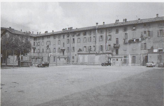
Campo di calcio dell'oratorio di Lugano (1978)