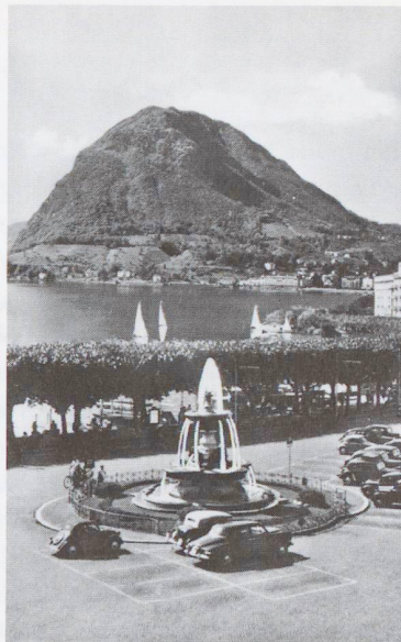
Quai e Monte S. Salvatore (1950)